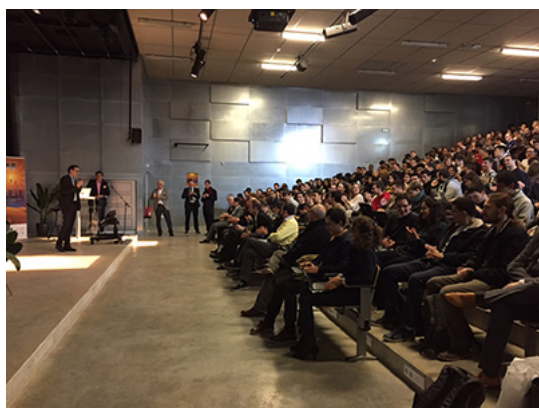
450 élèves de Télécom Ecole de Management et Telecom SudParis participent à la semaine de l'innovation et de la créativité

L'innovation numérique est devenue un enjeu majeur des entreprises, dans tous les secteurs de la mobilité à l'habitat et à la smart city, des nouvelles formes de commerce ou mieux vivre-ensemble. Il mobilise, en les combinant, les compétences des deux grandes écoles : l'ingénierie numérique et le management à l'ère du numérique. Plus qu'un challenge étudiant, les 2 écoles proposent à leurs étudiants de vivre une véritable expérience du management de la créativité collective.